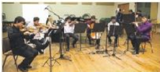
Los dos conciertos de cámara, diseñados por los 36 participantes del festival, ocurrirán desde el 06 al 10 de junio en la Sala Micaesp de la Universidad de La Serena.

En torno a la vinculación de su curso al territorio, el Departamento de Música de la Universidad de La Serena, Manuel señala que "es una excelente oportunidad para dar a conocer al trabajo que realizamos en La Serena, desde el valor de nuestra infraestructura universitaria y